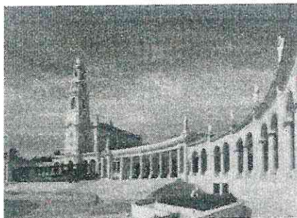
Santuário em Fátima, Portugal

O local da primeira aparição de Nossa Senhora de Fátima foi transformado em um Santuário, onde ocorrem peregrinações. Contudo, em 2020, devido à pandemia do novo coronavírus, o 13 de maio foi comemorado em Fátima sem peregrinos. Mas, assim como o cenário que nos assola, foi devido a uma pandemia de Gripe Espanhola que, há aproximadamente um século, morreram 2 dos pastorinhos, Francisco e Jacinta. O processo de beatificação deles foi feito no ano 2000, pelo Papa João Paulo, e, em 2017, o Papa Francisco visitou o Santuário de Fátima e canonizou os dois pastorinhos beatos. Eles são os mais jovens santos, não mártires, na história da Igreja Católica.